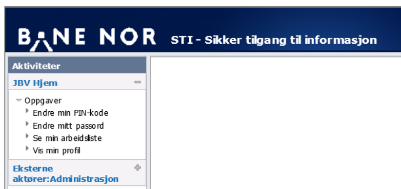
Skjermbilde av en innlogget bruker i STI brukeradministrasjon

Som sluttbruker eller applikasjonsbrukeradministrator i Identity Manager har man tilgang til følgende nettside for STI brukeradministrasjon