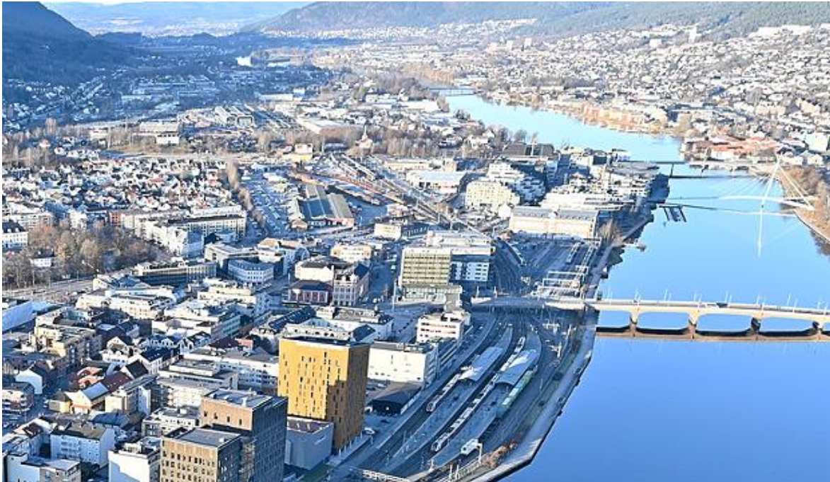
Oversiktsbilde av Drammen stasjon.