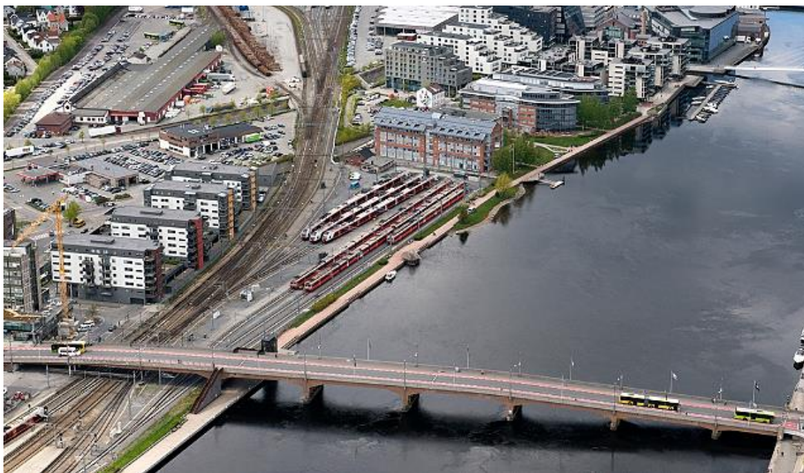
Drammen stasjon skal bygges om som en del av Intercity-prosjektet Drammen-Kobbervikdalen. Arbeidene er i gang.