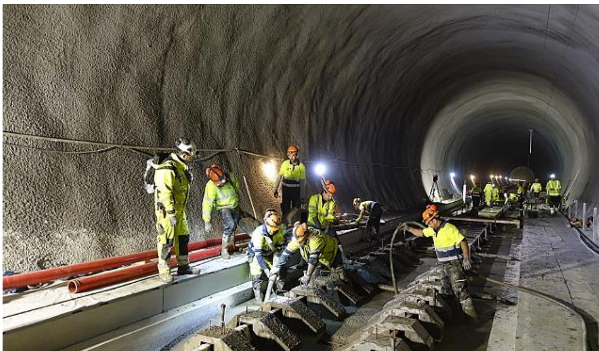
Jernbanespor som er støpt fast i grunnen har et lavere vedlikeholdsbehov enn spor som hviler på sviller og pukkkstein.

En åpenbar fordel med faststøpt jernbanespor er at det reduserer vedlikeholdsbehovet. Riktignok må skinnene fortsatt slipes, men behovet for å rense og skifte ut pukkksteinen under svillene faller bort. I tillegg må ikke faststøpt spor justeres like ofte som vanlig jernbanespor.