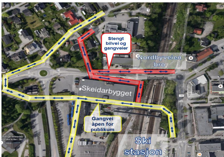
Kartet viser arbeidsområde ved riving av Nordbyveien bro i påsken. Stengte veier markert i rødt, åpne markert med gult.

Anleggsarbeidene fører til at Nordbyveien bro og deler av Nordbyveien blir stengt fra 19.3 kl. 10.00. Vi ber gående og syklende benytte gang- og sykkelstien på sørsiden av Skeidarbygget og over gangbrua ved stasjonsområdet. For spørsmål angående kollektivtransport kan NSB og/eller Ruter kontaktes. Vi gjør oppmerksom på at Nordbyveien bro og deler av Nordbyveien blir stengt fram til ny bro er planlagt ferdig senhøsten 2016.