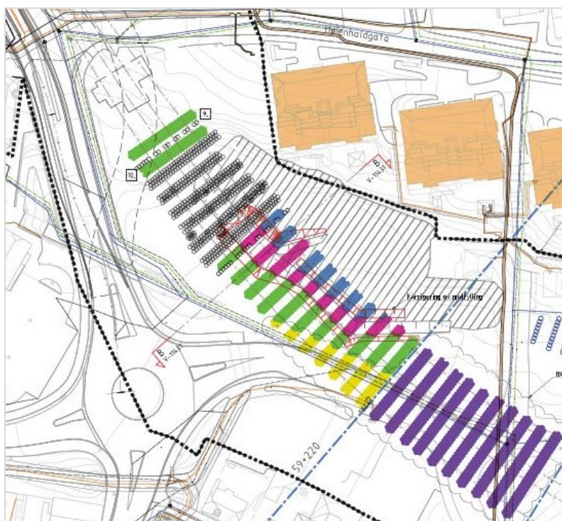
Figur 1. Oversiktsbilde av Kransen Nord, som illustrerer arbeidet som skal utføres med jetpeling. De forskjellige fargene viser fasene, der de begynner med de grønne rekkene, deretter følger de blå, rosa, gule og til slutt de lilla rekkene.

Lørdag vil det være jetpeling fra kl. 8 til kl. 16. Vasking vil være avsluttet innen kl. 19.