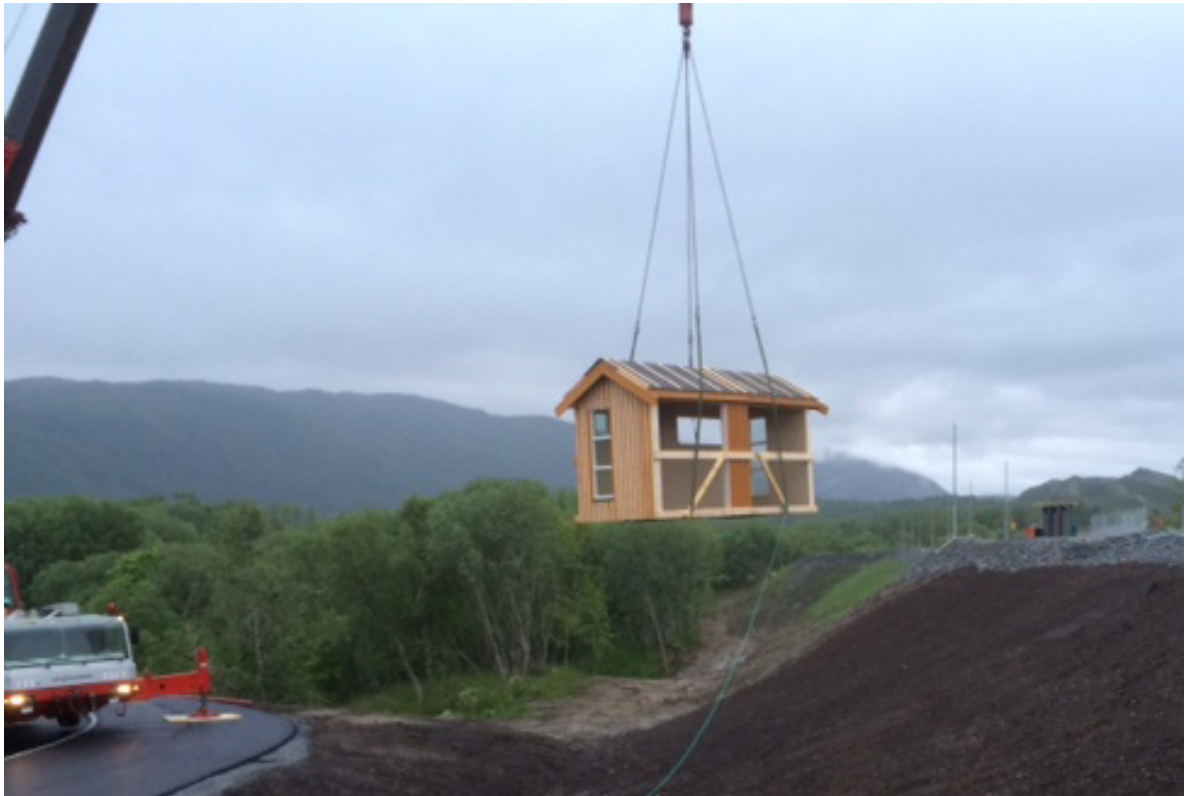
Løftes på plass: Leskuret løftes på plass og monteres på holdeplassen.