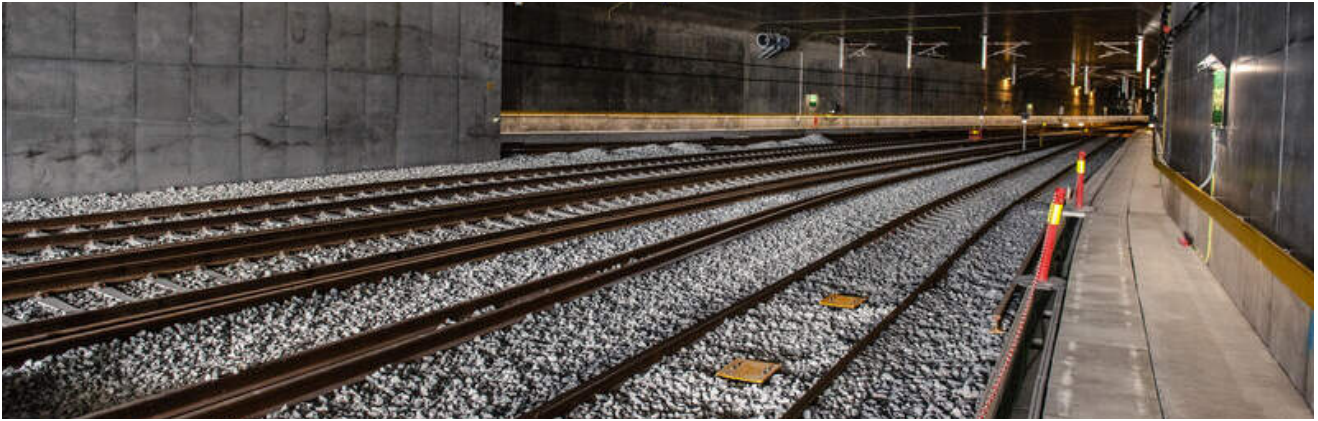
Betongtunnelen nær Oslo S blir nordre del av Blixtunnelen når den åpnes for trafikk 12. desember 2022.