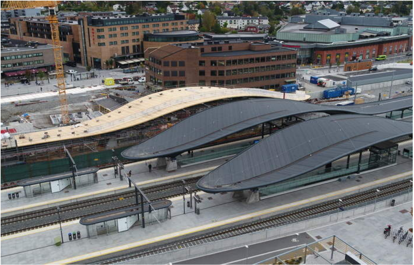
Alle plattformtakene er løftet inn på Ski stasjon. Arbeidet med den gjennomgående undergangen mellom øst og vest pågår frem til august 2022.