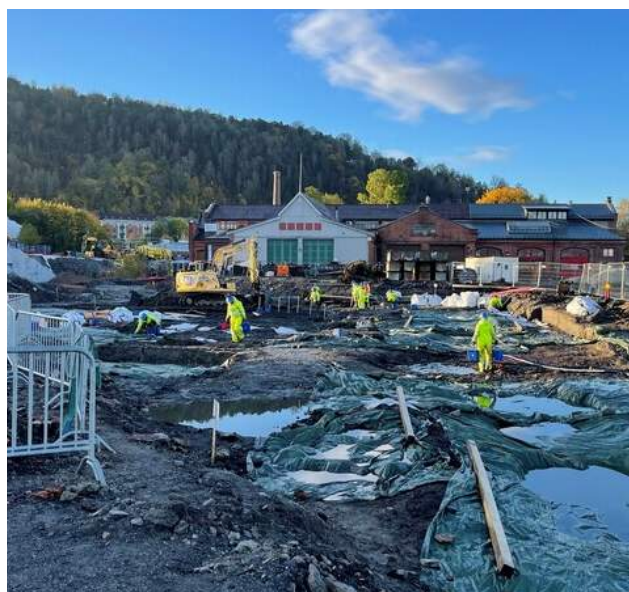
Middelalderparken skal rustes opp. Et samarbeid mellom Oslo kommune, Riksantikvaren og Bane NOR. Her er arkeologene i arbeid.

På Vevelstad er det gravearbeid og anleggstrafikk, men entreprenøren gjør seg ferdig så raskt som mulig. På Vevelstad pågår også installasjoner i trafobygget og dette arbeidet fortsetter i 2022.