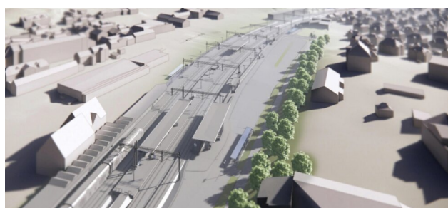
Illustrasjon: Tønsberg stasjon med fire spor til plattform, sett mot nord.

Påmelding til unb@banenor.no innen 26. februar.