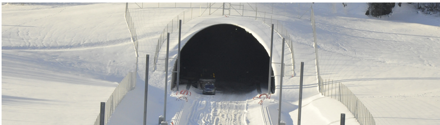
Tunnelåpning Eidangertunnelen retning Porsgrunn i Herregårdsbekken.