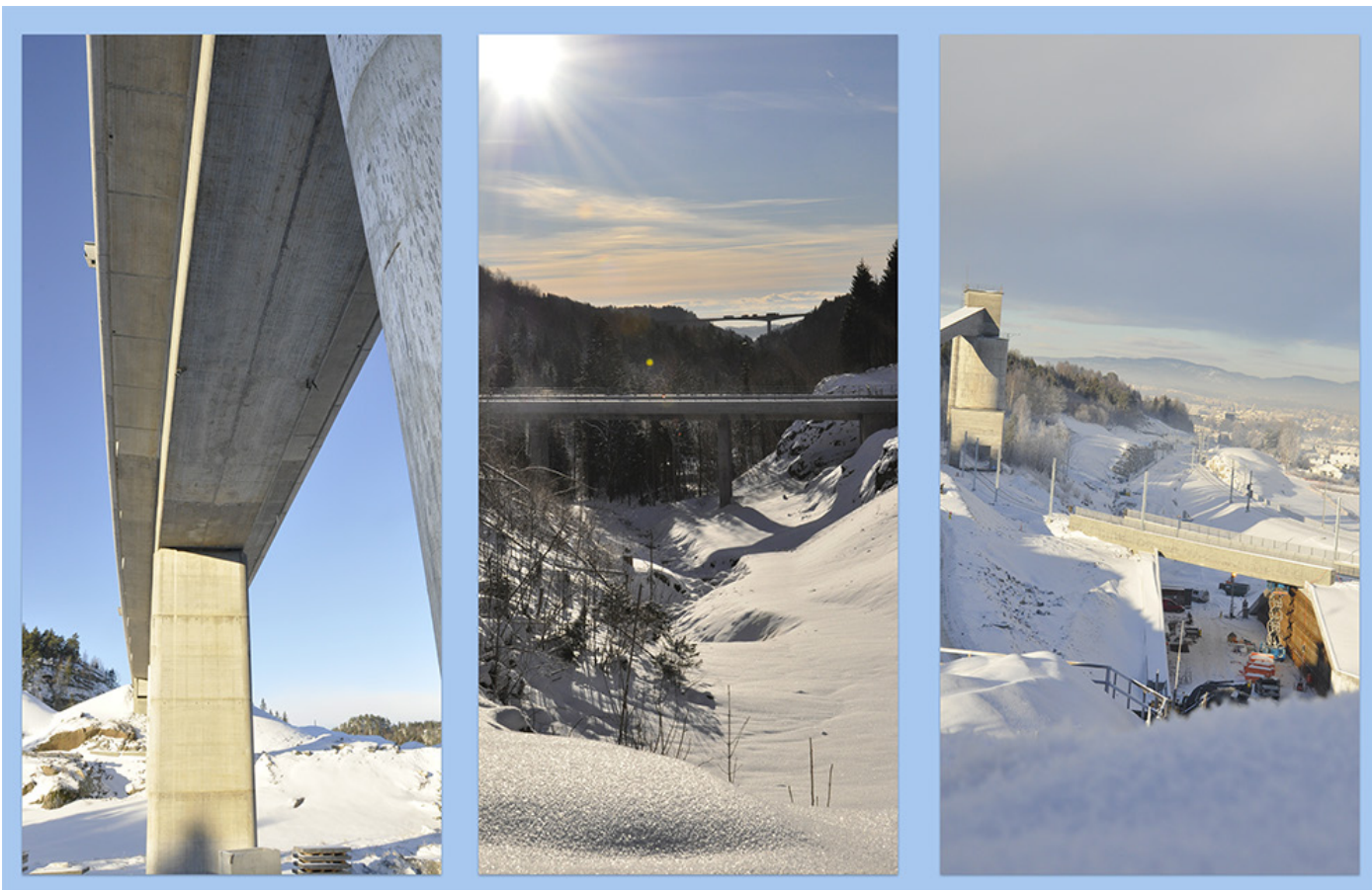
Fra venstre: Solum bru (ved gamle Solum vektstasjon i retning Telemark). Gunnarsrød bru på vei inn Langangen og utsikt fra over tunnelåpningen i retning Porsgrunn stasjon over Vallermyrene.