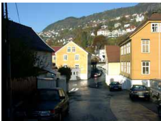
Illustrasjon 3: Kalfarveien sett fra Fløenbakken i sør, foto nov. 2002. Til høyre i bilde ser vi Kalfarveien 122 og 120. Nede til venstre ligger Kalfarveien 99.