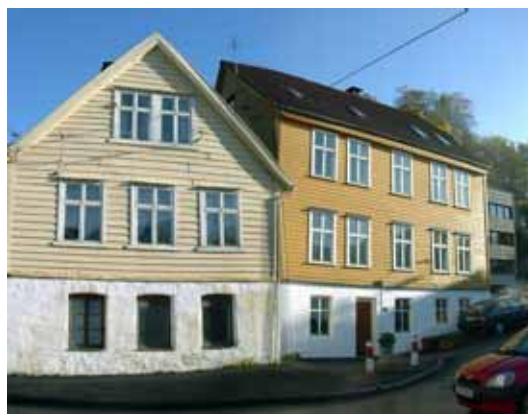
Illustrasjon 7: Kalfarveien 120 og 122, foto nov.2002.