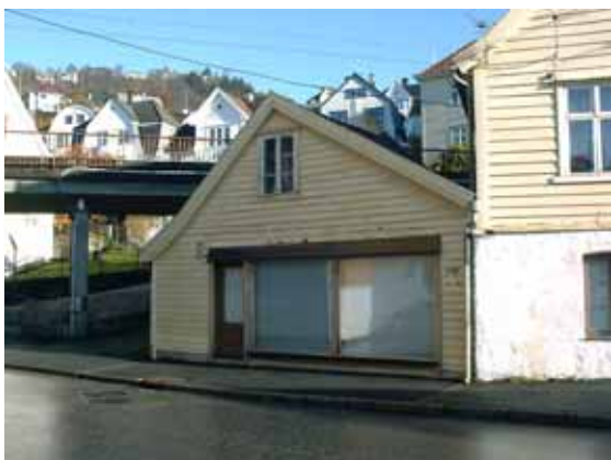
Illustrasjon 6: Kalfarveien 120, foto nov.2002.

Bolighus i tre, sveitsestil. Bygget på slutten av 1800-tallet.