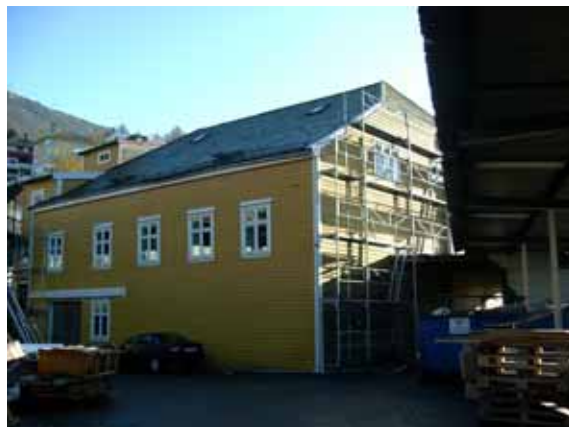
Illustrasjon 5: Kalfarveien 99, foto nov. 2002. Tidligere naust som er bygget inn, sett fra nordvest.