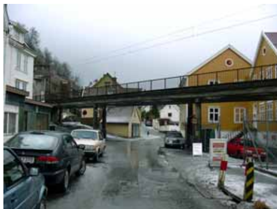
Illustrasjon 4: Kalfarveien med kryssende jernbanelinje. Til venstre bak jernbanebro ligger Kalfarveien 120, til høyre ligger Kalfarveien 99. Foto des. 2002.