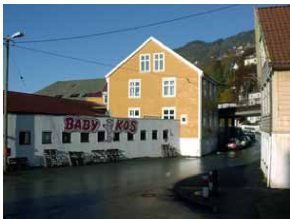
Illustrasjon 2: Kalfarveien 99, foto nov.2002. Lagerhall til venstre i bildet er bygget i 1958. Gult bygg midt i bildet finner vi på kart fra 1883.

Lagerhall sør på tomten er bygget i 1958.