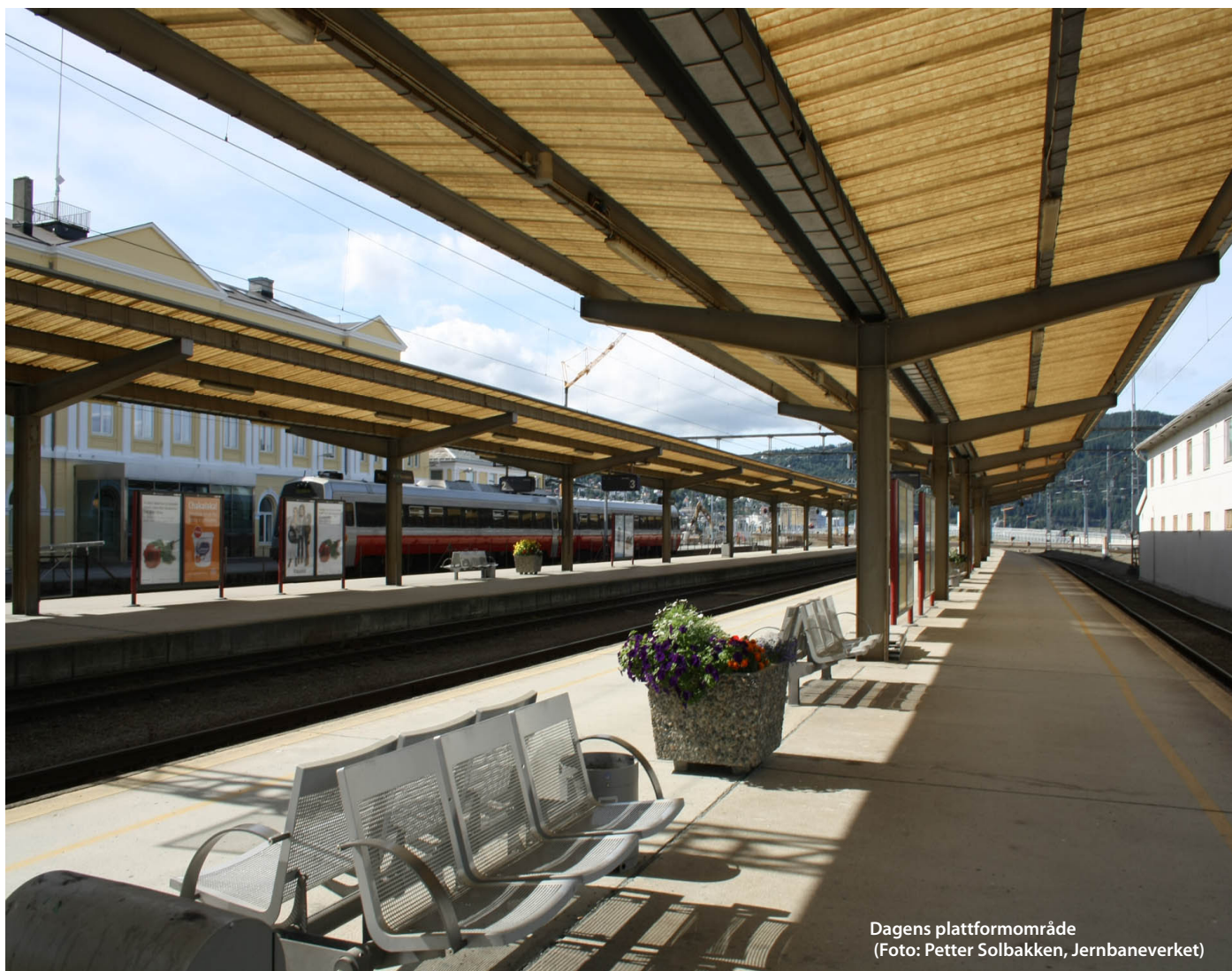
Dagens plattformområde