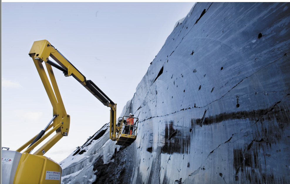
Wiresaging. Ved Engervannet skal om lag 70 000 kubikkmeter fjell sages bort.