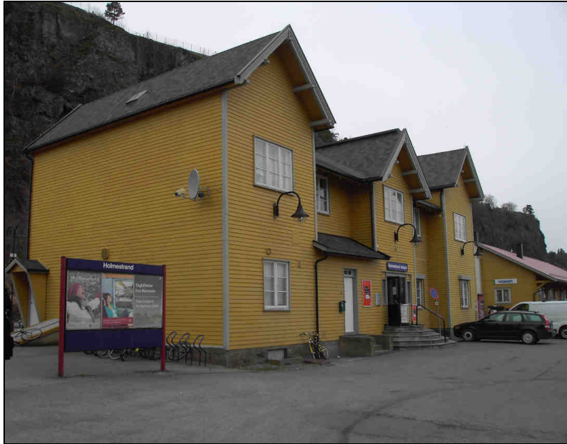
Billede 2: Holmestrand Stasjon