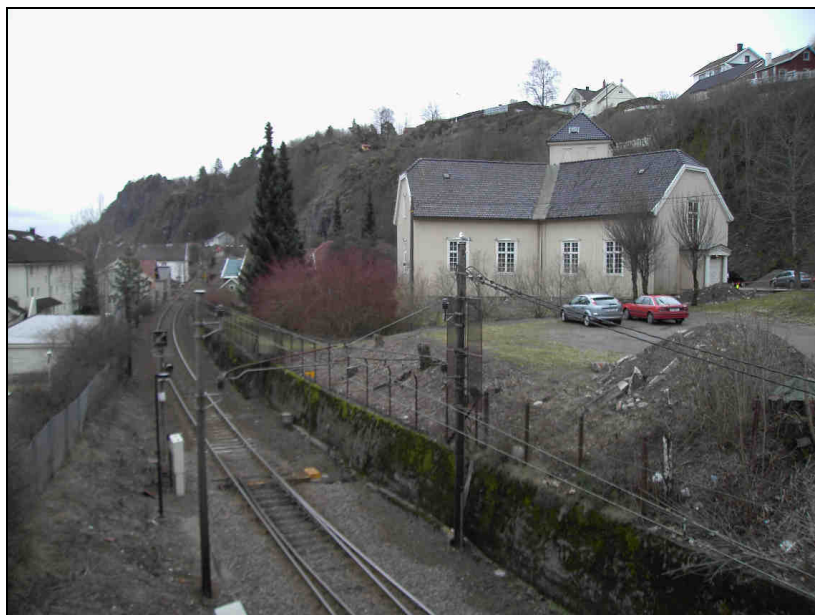
Billede 1: Holmestrand Kirke. I forgrunnen den eksisterende jernbane

Presise retningslinjer i forhold til best mulig beskyttelse av kirken under anleggsarbeidet skal fastsettes i samarbeide med Kirkevergen, Riksantikvaren og kulturavdelingen i Vestfold fylkeskommune.