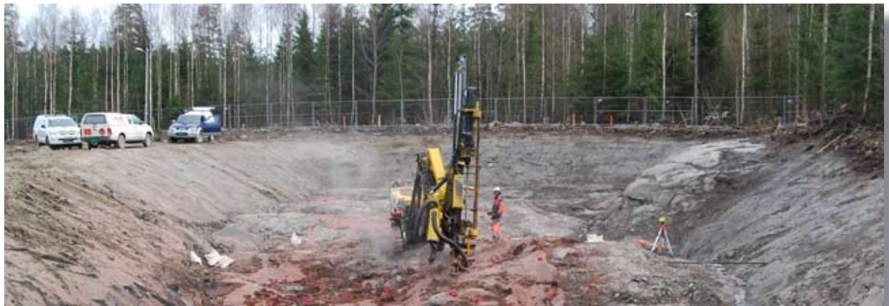
(Det gjøres klar for sprengning i forskjæringen til tverrslagstunnelen i Kjellelia.)

Jernbaneverket har startet byggingen av nytt dobbeltspor fra Barkåker til Tønsberg. Den første grunnentreprisen startet opp 2. mars og prosjektet er i rute.