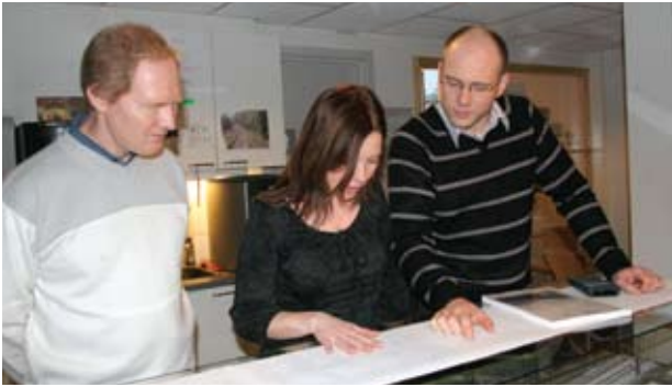
Drøftelser av tekniske løsninger.