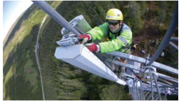
Montasje av GSM-R.

En teknologisk utvikling med moderat teknisk og økonomisk risiko vil også være et naturlig valg ut fra JBVs store omfang av enkeltsporet drift og stjerneformede jernbanenett. En slik banestruktur kan medføre store negative konsekvenser for togdriften (og togselskapene) ved utfall av anlegg og systemer som følge av for stor teknisk risiko i forbindelse med utprøving og etablering av ny teknologi.