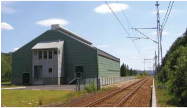
Leivoll omformerstasjon.