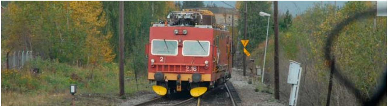
Arbeidstog for vedlikehold og montasje.