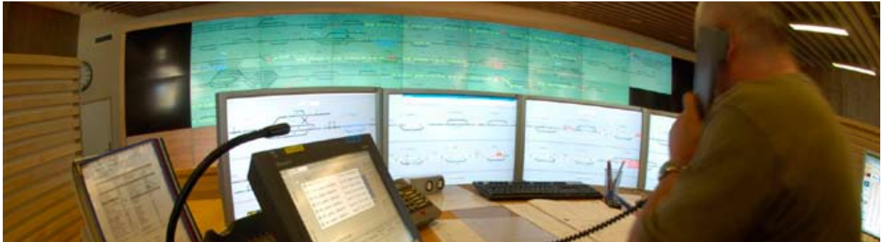
Trondheim togledersentral.

Ved anskaffelse av komponenter og ved prosjektering av nye anlegg skal prosessstandard EN-50126 anvendes. Denne krever at det utarbeides krav til pålitelighet, vedlikeholdbarhet og sikkerhet for komponenter og anlegg tilpasset behovene for den berørte banestrekningen. Gjennom dette arbeidet forventes at det oppnås ytterligere økt oppetid for infrastrukturen.