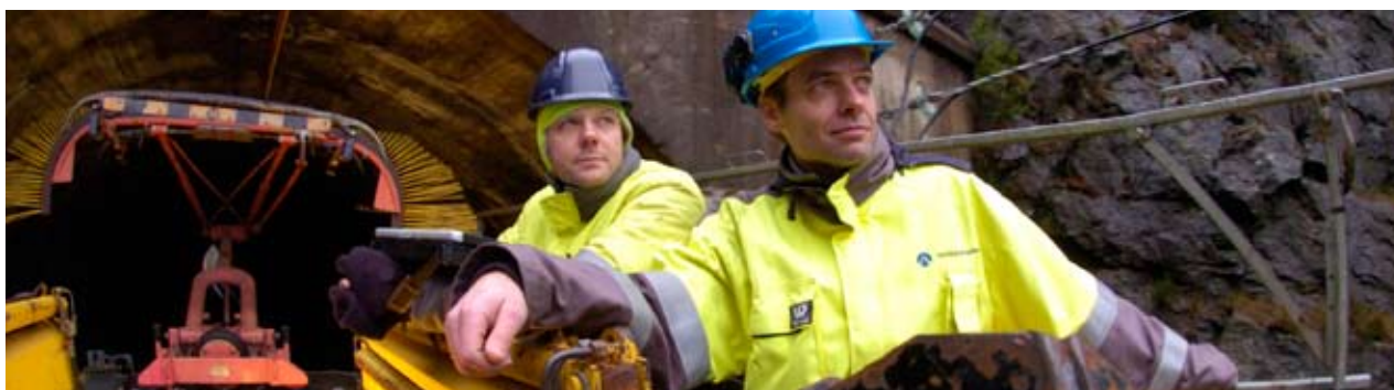
Bygging av kontaktledning.

basisområder. En viktig hensikt med slike oppgraderinger må imidlertid være at anlegg og systemer dermed gir bedre nytteverdi for togtrafikken og brukerne. Noen oppdateringer vil JBV måtte foreta for å opprettholde fortsatt produktstøtte fra leverandørene.