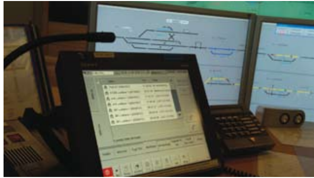
GSM-R terminal.

anvendelsesområde, grensesnittenes kompleksitet, hvilken teknologi som velges i de større jernbaneforvaltningene, når det bør foretas en endelig beslutning om overgang til ny teknologisk plattform, tidspunkt for den første implementeringen, og implementeringstakt. For tilfeller der bruken av kjent, etablert og utprøvd teknologi ikke fører frem til de ønskede ytelsesmålene må saken behandles særskilt.